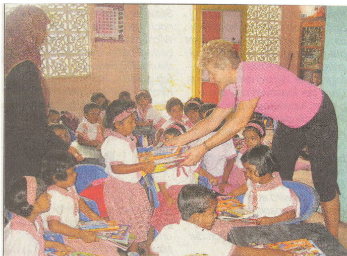
Elf Kindergärten hat die Hilfsinitiative inzwischen gebaut oder grundlegend saniert. Neues Lehr- und Spielmaterial haben die Eyerkaufers fast immer im Gepäck.