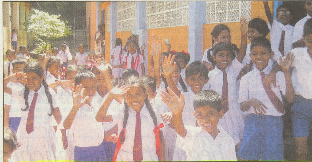
Jubel in der Beruwala Primary School, eine der ersten Schulen, in denen die Bürger des Main-Kinzig-Kreises nach dem Tsunami halfen.

Wer sich an der langfristigen Hilfe für Beruwala beteiligen möchte, dem steht das Konto „Main-Kinzig-Kreis hilft Beruwala“, Nummer 99994, bei allen drei Sparkassen im Main-Kinzig-Kreis zur Verfügung. Die Bankleitzahlen lauten für die Sparkasse Hanau 50650023, für die Kreissparkasse Gelnhausen 50750094 und für die Kreissparkasse Schlüchtern 53051396.