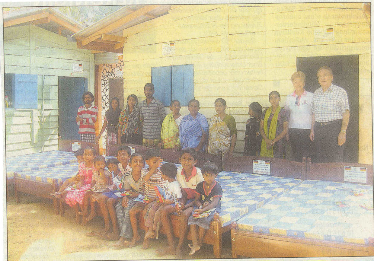
Betten statt nackter Erde - für die armen Großfamilien keine Komfort-, sondern eine Gesundheitsfrage.