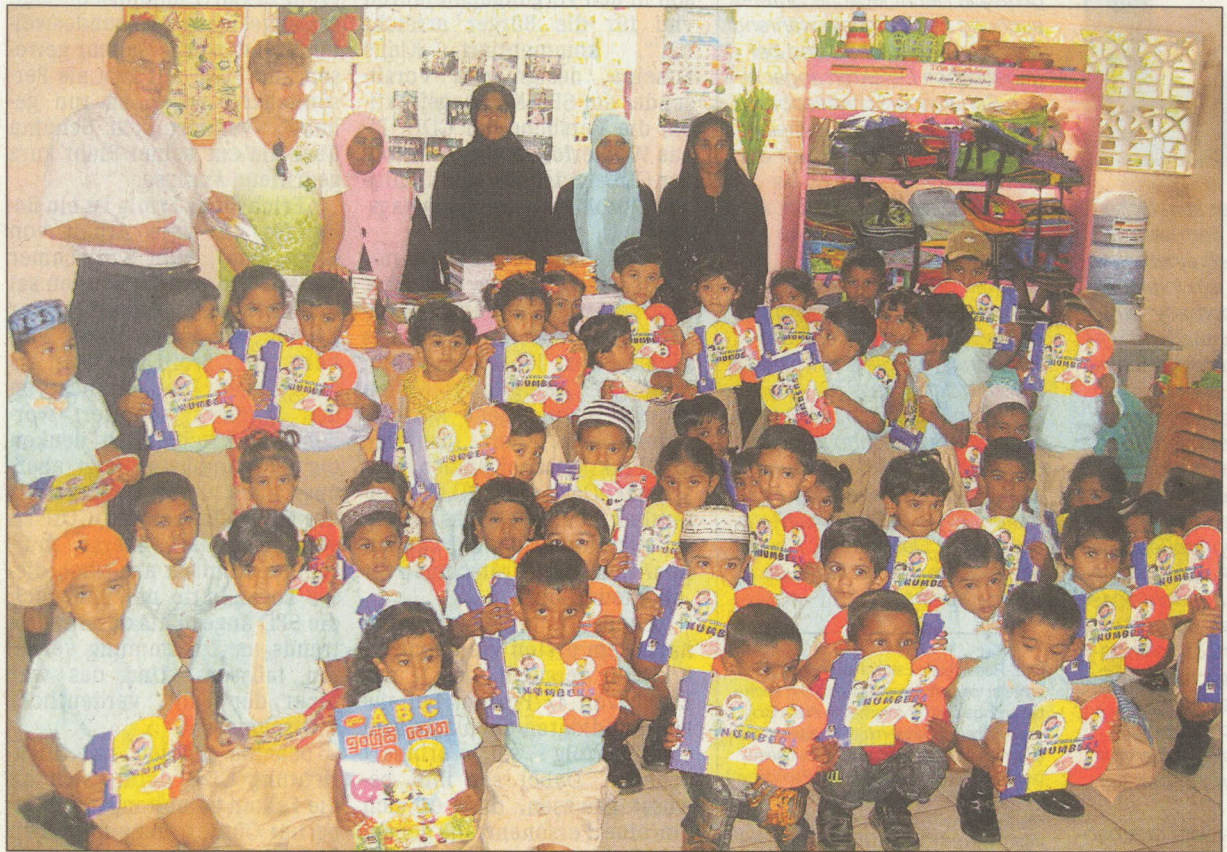
Der Main-Kinzig-Kindergarten war eines der ersten Projekte nach dem Tsunami.