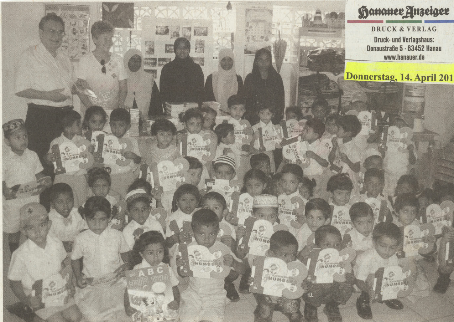
Die Kleinsten freuten sich im Kindergarten über neue Bücher.