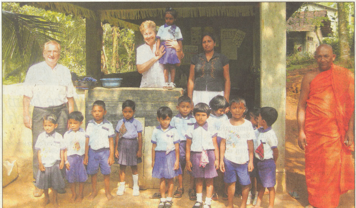
Am Kindergarten Pipena Kekulu entstehen statt dieser offenen Holzhütte ein wetterfestes Haus und hygienische Toiletten. Die Kinder freuen sich schon.