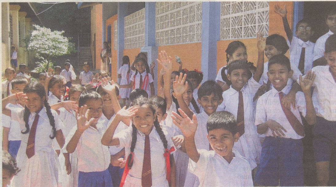
Jubel in der Beruwala Primary School.

In den neun Kindergärten und 31 Schulen, die mit Geld aus dem Main-Kinzig-Kreis gebaut und saniert wurden, läuft schon die erste Renovierungs- und Instand-