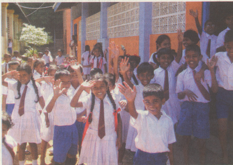
Dass die Jungen und Mädchen der Grundschule von Beruwala Grund zum Jubeln haben, verdanken sie auch den Bürgern des Main-Kinzig-Kreises, die den Aufbau nach dem Tsunami finanziell unterstützten.

In den neun Kindergärten und 31 Schulen, die aus Spenden der Bürger aus dem Main-