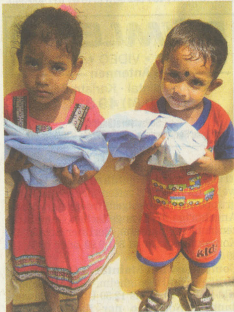
Diese Blicke entschädigen für alle Mühe. Neue Schulkleidung für den Kindergarten der Gründauer Stiftung Kinderzukunft.

Wer sich an der langfristigen Hilfe für Beruwala beteiligen möchte, dem steht das Konto „Main-Kinzig-Kreis hilft Beruwala“, Nummer 9 99 94 bei allen drei Sparkassen im Main-Kinzig-Kreis zur Verfügung. Die Bankleitzahlen lauten für die Sparkasse Hanau 506 500 23, für die Kreissparkasse Gelnhausen 507 500 94 und für die Kreissparkasse Schlüchtern 530 513 96.