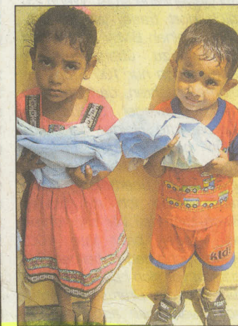
Neue Kleidung für den Kindergarten der Gründauer Stiftung Kinderzukunft.